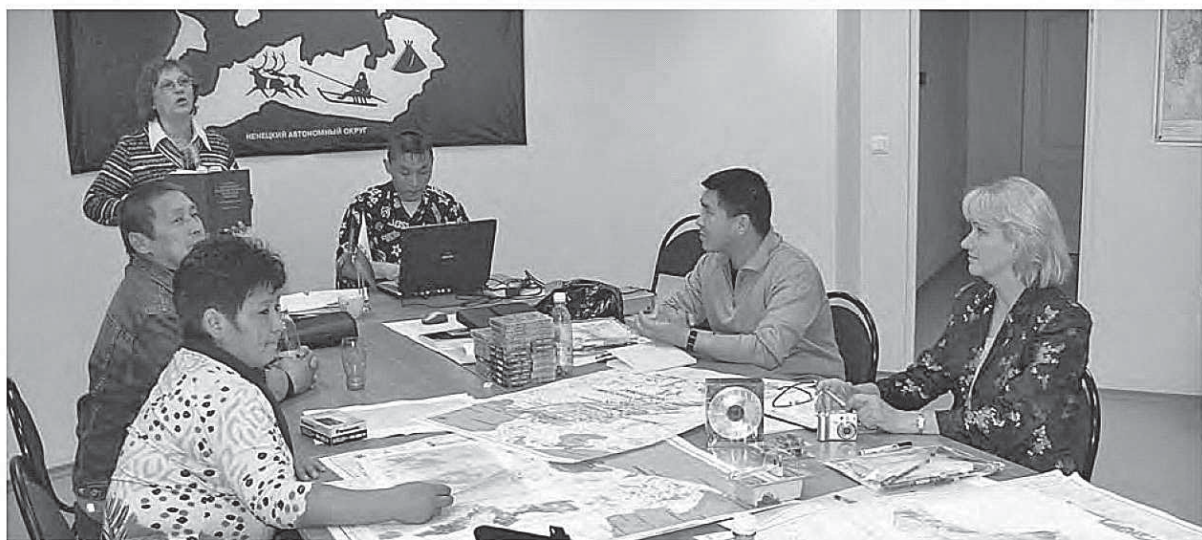
Семинар в г. Нарьян-Маре, во время подготовки интервьюеров, сентябрь 2007